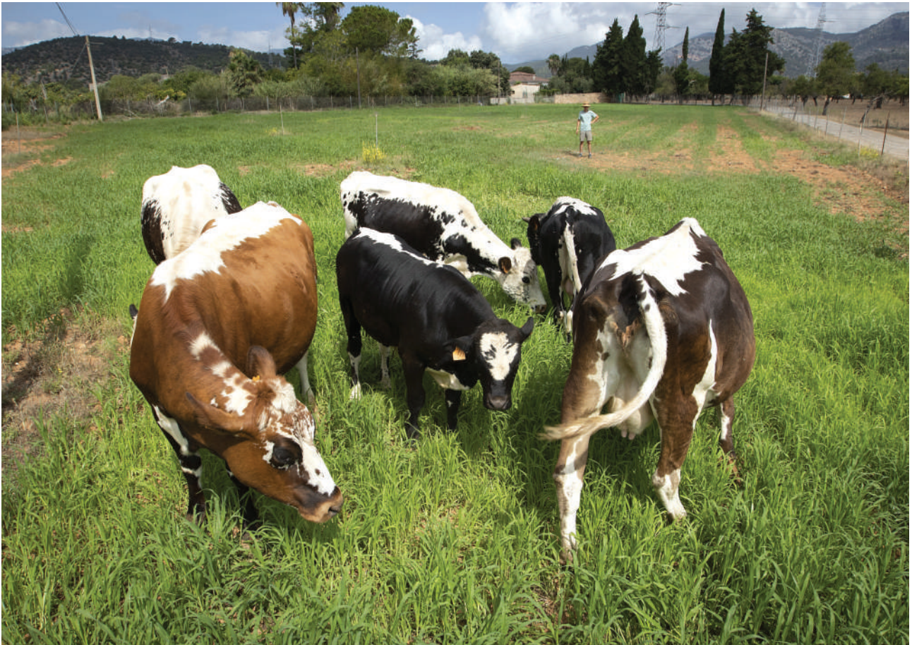
La capa és de fidelitat racial, combinant el blanc amb negre o vermell normalment, on la típica retxa blanca al llarg de la línia dors-lumbar (patrò Pinzgauer) pot estar més o manco desenvolupada.