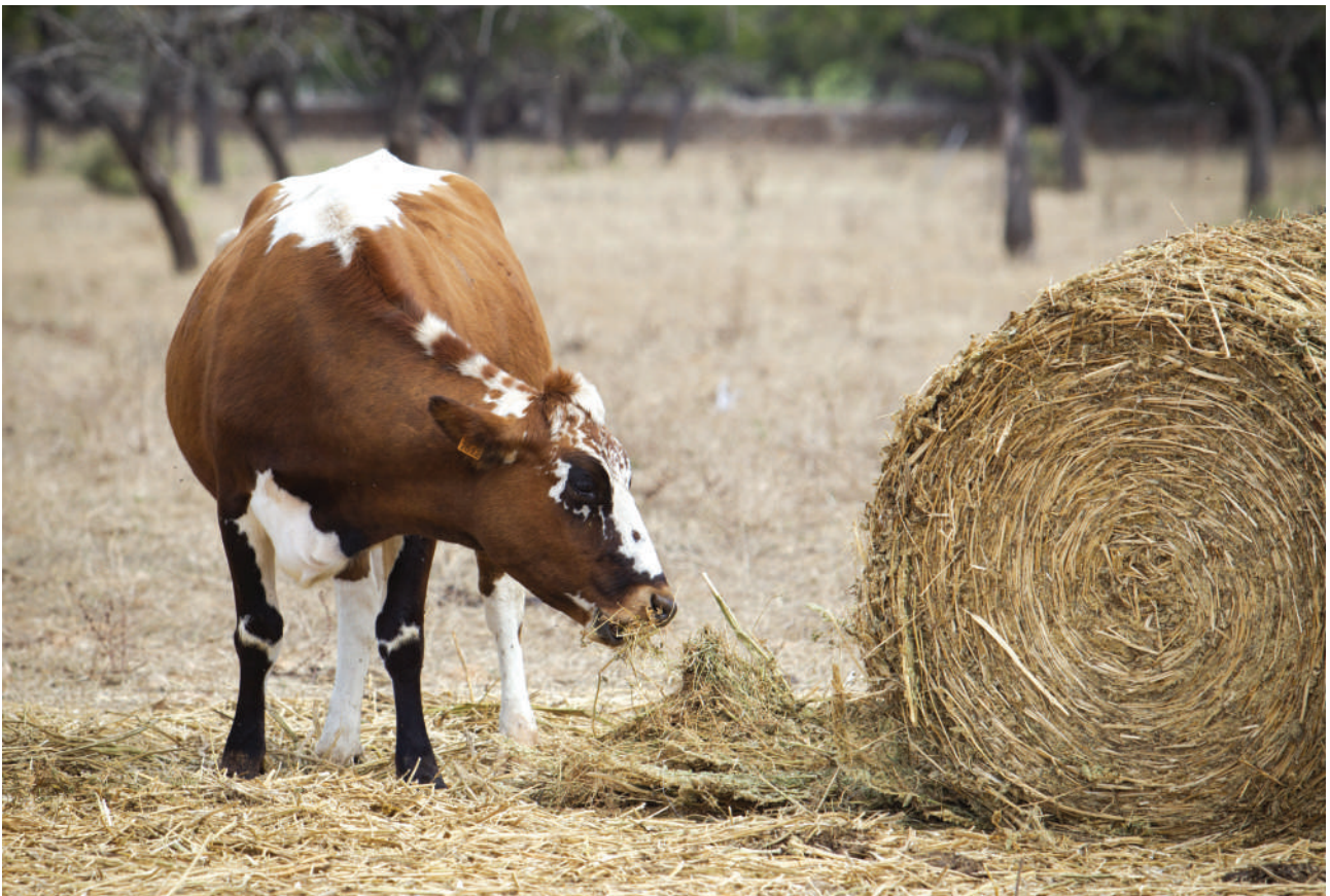
Com es pot apreciar en aquest exemplar, són animals calçats en les extremitats posteriors i solen presentar major presència del negre o vermell en les extremitats anteriors.

Responsable dels Programes de Cria de les RRAA a SEMILLA